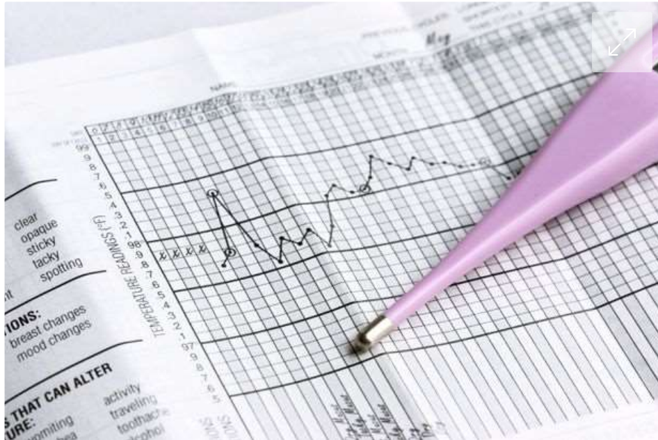
Zyklusblatt: Eine sorgfältige Dokumentation ist für die Sicherheit der NFP unerlässlich

»Wir beobachten einen Trend hin zu einem besseren Körperbewusstsein und vor allem Verständnis für den eigenen Zyklus, auch der Altersdurchschnitt der Paare ist gesunken.« Außerdem gebe es inzwischen einige Apps, die bei der Aufzeichnung der Zyklusdaten helfen. Klann-Heinen sieht auch darin einen Grund, warum die Methode auf einmal wieder an Popularität gewinnt.